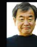
基調講演 隈 研吾 建築家