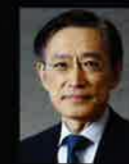
特別講演 川元 茂 国土交通省 大臣官房 官庁営繕部長

HPから 事前登録 で参加費無料!! 申し込み→ http://www.jfma.or.jp/FORUM/2017/page4.html